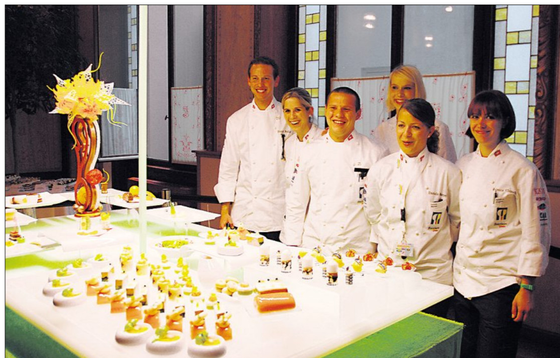
La «Kochnati» junior a dévoilé la table d'exposition qu'elle étrennera lors la Culinary World Cup prévue en fin d'année au Luxembourg. Une façon de rappeler qu'il n'y a pas qu'au football que les Suisses ont de l'ambition.

Si le match a bouclé dans une belle liesse la manifestation bernoise, la journée n'en a pas moins été studieuse. En plus des conférences thématiques organisées le matin et l'après-midi (lire pages 8 et 9), le Forum a accueilli l'Equipe nationale junior de cuisine de la Société suisse des cuisiniers. Les jeunes professionnels ont livré un aperçu de leurs talents en dévoilant la nouvelle table d'exposition qu'ils présenteront à la Culinary World Cup, prévue en novembre prochain au Luxembourg.